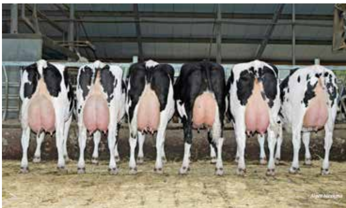
4 van de 6 Disclosure dochters zijn nog op het bedrijf aanwezig, hun gemiddelde productie is ruim 90.000 kg melk

Een mooie mijlpaal was de groepsfoto van de 6 Disclosure dochters op ons bedrijf in 2019. Dat de laatste jaren steeds meer koeien de 100.000 kg volmaken is natuurlijk ook een bewijs van de goede gang van zaken, de teller staat inmiddels op 36. In het voorjaar van 2024 kregen we 9 Miura dochters aan de melk waarvan er 5 op de foto zijn gezet. Na de Disclosure groep vinden we dit weer een bijzonder moment. Eén vaars gaf op haar top 36 kg melk, de andere 8 tussen de 42 en 46 kg per dag. Daarbij lijken ze bovendien persistent. De Miura dochters zijn erg prettig om mee te werken ze lopen goed op de robot. Ze hebben een zeer aangenaam karakter en een ideale melkbaarheid. Met daarbij zonder uitzondering gezonde uiers. De beste, iets kromme benen met de gezonde klauwen is één van