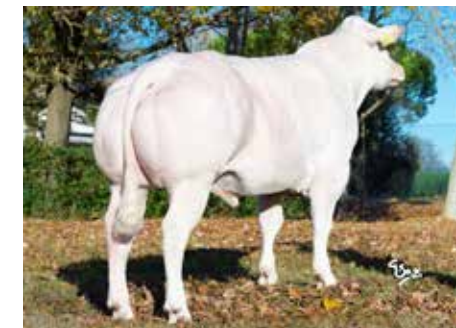
Topstier in BWB: Expression van de Plashoeve

stieren blinken uit in makkelijke geboorten en vlot groeiende kalveren in de eerste weken. Op dit moment hebben we met Edgar de volle broer van Eiffel in de testfase. Daarnaast hebben we met Ezra P de eerste heterozygoot hoornloze BVVB stier in ons programma.