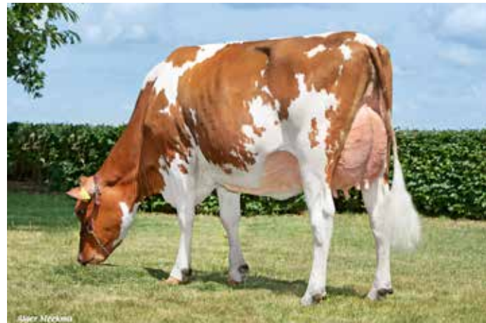
Raglan dochter No 16, Vijzelaar de Boer, Zeewolde

Groenibo Sardo Red PP combineert de unieke eigenschappen; aAa code 513 en homozygoot hoornloos. Moeder van Sardo Red PP is de volle zuster van de veel gebruikte Duitse fokstier Rambo PP.