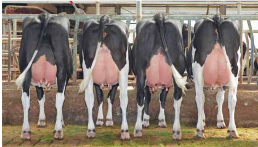
Miura dochtergroep, de vijfde dochter is individueel gefotografeerd en is te zien op de website

“De eerste Prince dochters hebben de 100.000 kg inmiddels overschreden en van de lichte daarvoor zijn 2 Virzil dochters al de 10.000 kg vet en eiwitgrens gepasseerd. Dat is ook altijd ons doel geweest: probleemloze koeien met uiteindelijk een hoge levensproductie. Op dit moment melken we 15 100.000liter-koeien. De Veecom filosofie sprak ons altijd al aan; een niet te grote koe gefokt op gezondheids- en levensduurkenmerken.