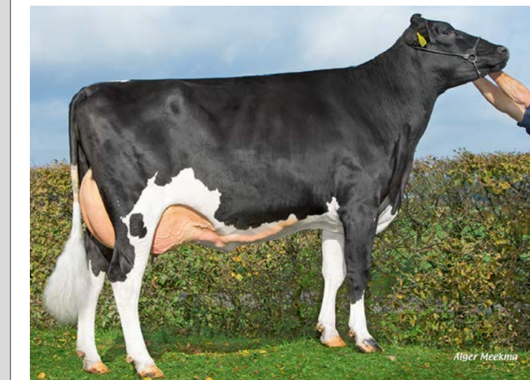
Disclosure dochter Marie 257, Mts Reinders, Anevelde

me conditiescore. Disclosure's zijn uitgebalanceerde dieren met veel breedte en kracht, en laten veel van hun vaders aAa-code (516432) zien. Door hun brede en krachtige bouw beschikken ze over veel stabiliteit, capaciteit en vermogen. Zowel op de intensieve als ook meer grasrijke rantsoenen kunnen ze daarom prima uit de voeten. Kenmerkend zijn verder de goed gevormde kruizen en sterke klauwen. Als vaars doen ze wat rond aan, maar tijdens latere lactaties laten ze steeds meer kwaliteit zien. Disclosure's zijn koeien die weinig arbeid vragen. Ze produceren melk die bovendien zeer geschikt is voor de kaasbereiding. Disclosure is pinkenstier en bevrucht uitstekend. Wij zijn er steeds meer van overtuigd; Disclosure is de nieuwe Prince.