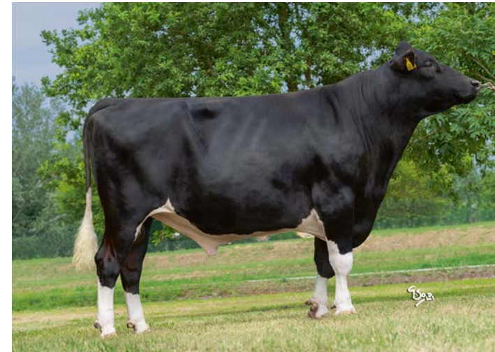
FaWi Big Deal aAa 165 Big Spell x Jorryn x Abrian

Allegro levert via oud bloed beste vaarzen die veel produceren. Triple Threat (1972) is bijna 50 jaar geleden geboren en was een topstier in zijn tijd. Ook bij Prince met MToto x Rudolph x Skywalker is de afstamming oud, maar puur goud. Ook Big Spell heeft met Bertil x Ramos een belegen bloedvoering. Toch produceren de Allegro vaarzen ver boven verwachting en stijgt de productie-index door de persistentie en laatrijphed van vaars naar tweedekalfs met 600 kg melk.