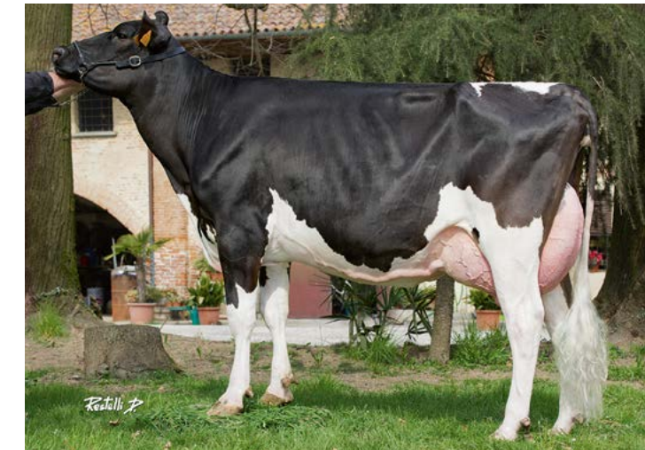
Miura dochter Sacra

Ze hebben daarbij gezonde, makkelijk werkbare uiers. Miura vererft een aantal eigenschappen die je wereldwijd zelden in één stier vindt. Hij is pinkenstier,