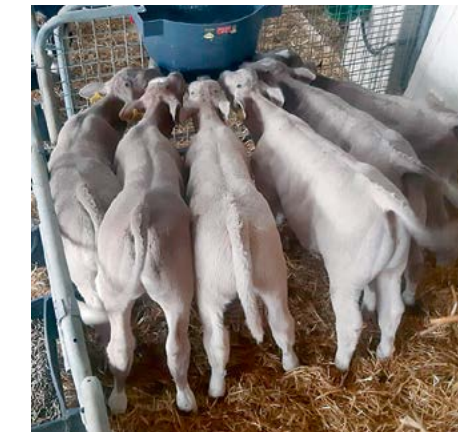
INRA 95 kalveren ten voeten uit: op en top vitaliteit

In onze vorige Veecommunicatie hebben wij verteld over de nieuwe BVVB stieren in ons programma: Ribeye en Expression, waarvan inmiddels de eerste kalveren zijn geboren. Expression en Ribeye bevruchten goed. Van Ribeye worden de kalveren gemakkelijk geboren en hebben veel breedte.