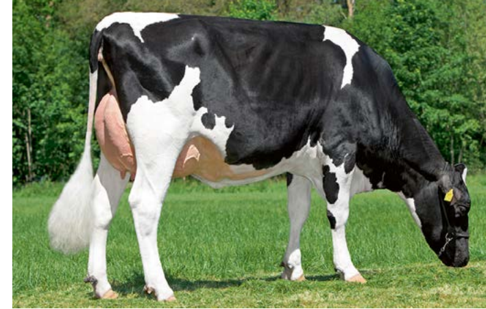
Trix 95 v. FaWi Caruso, Mts.Thijert, Deurningen

Zo kan het Farmers Wish programma worden voortgezet. En zo kan Veecom dus blijven voldoen aan de gewenste kwaliteit in de breedte. In deze uitgave van de Veecomcommunicatie en op de nieuwe stierenkaart presenteren we een aantal interessante nieuwe FaWi stieren.