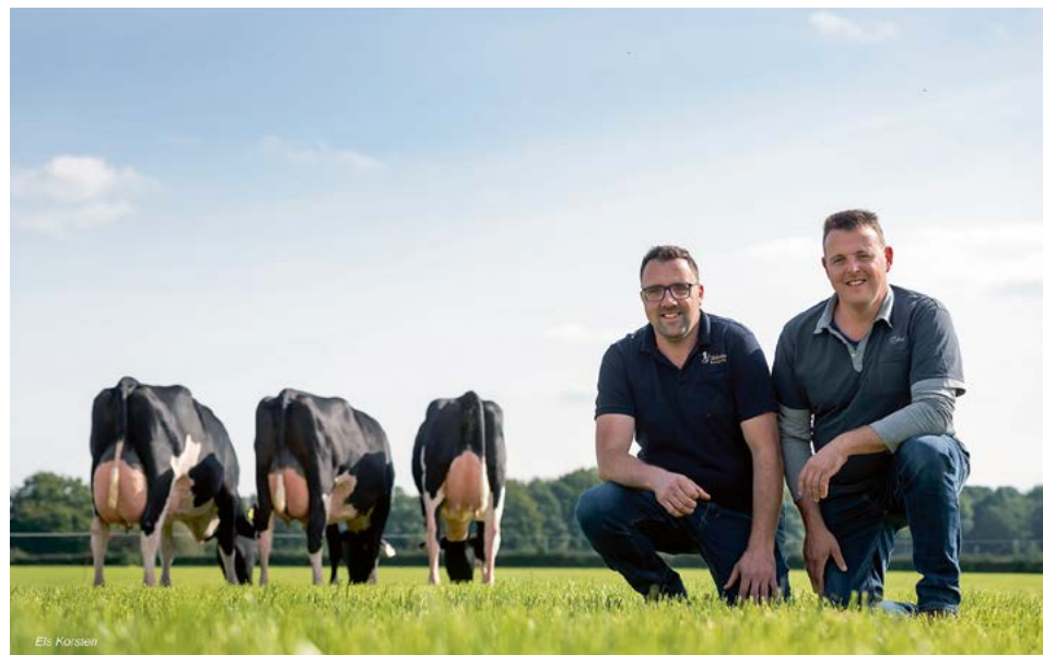
"De Malki dochter (links) is voor ons een voorbeeldkoe, de Savoia dochters hebben de kwaliteit om in haar voetsporen te treden."